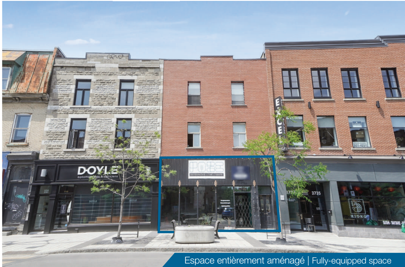
Espace entièrement aménagé | Fully-equipped space