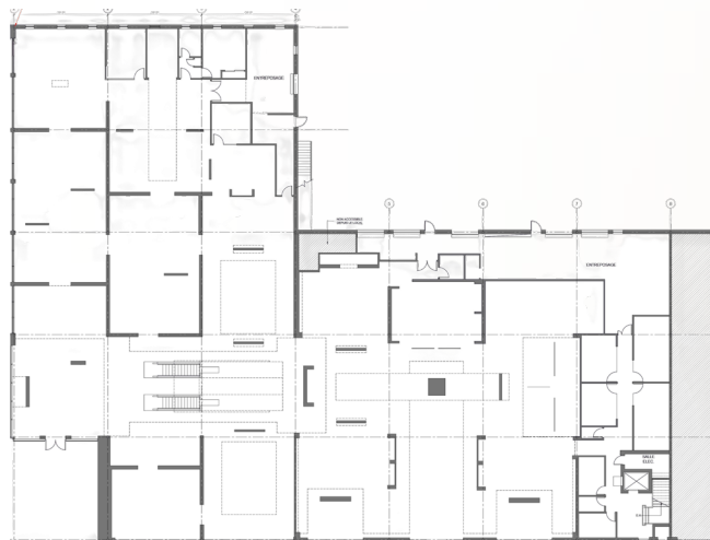
RDC | Ground Floor