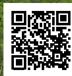
Visite virtuelle Virtual tour