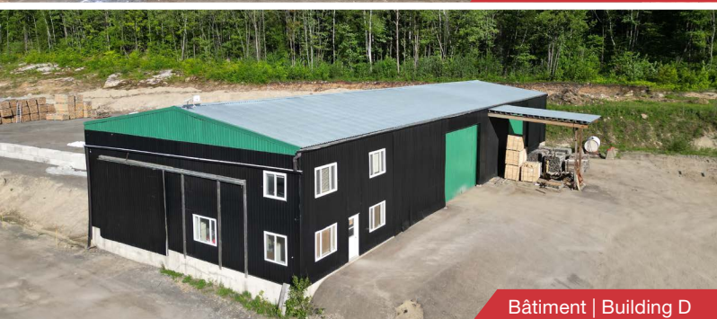
Bâtiment | Building D