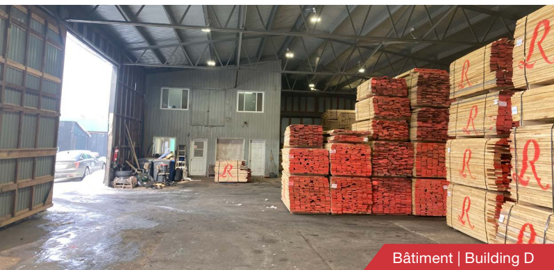
Bâtiment | Building D