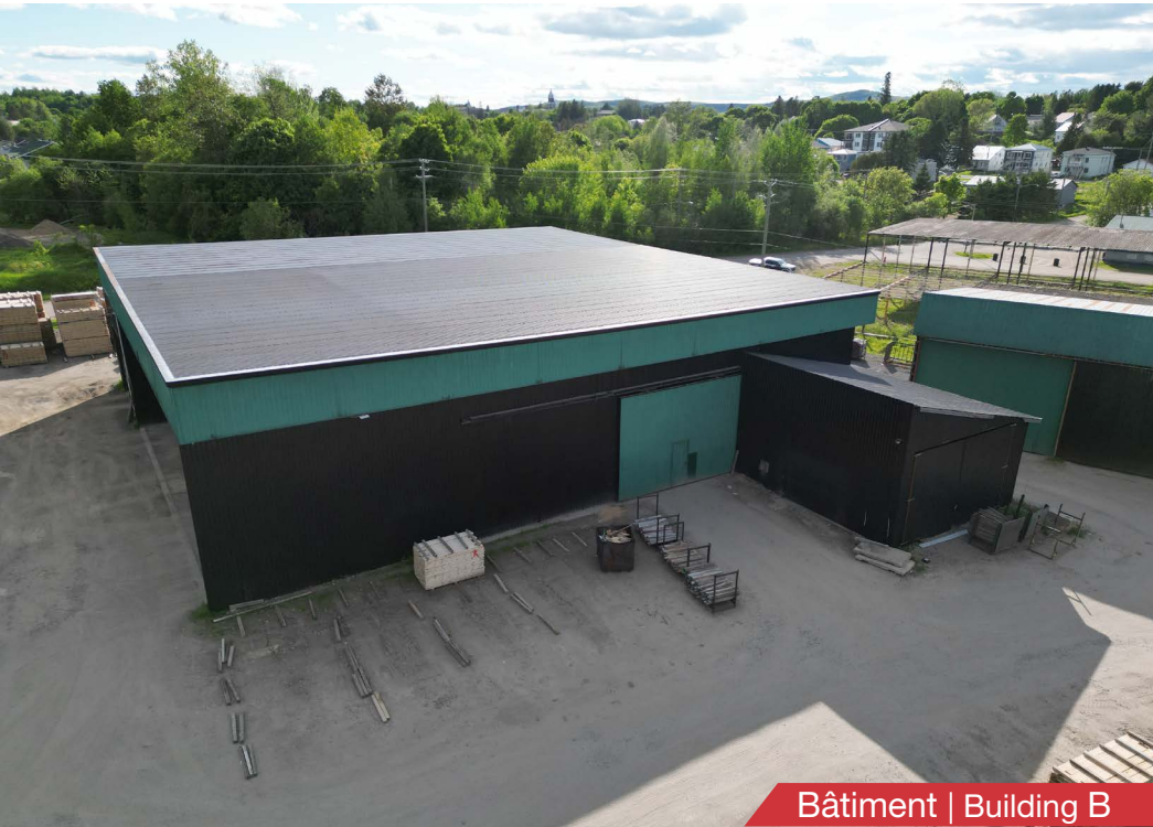
Bâtiment | Building B