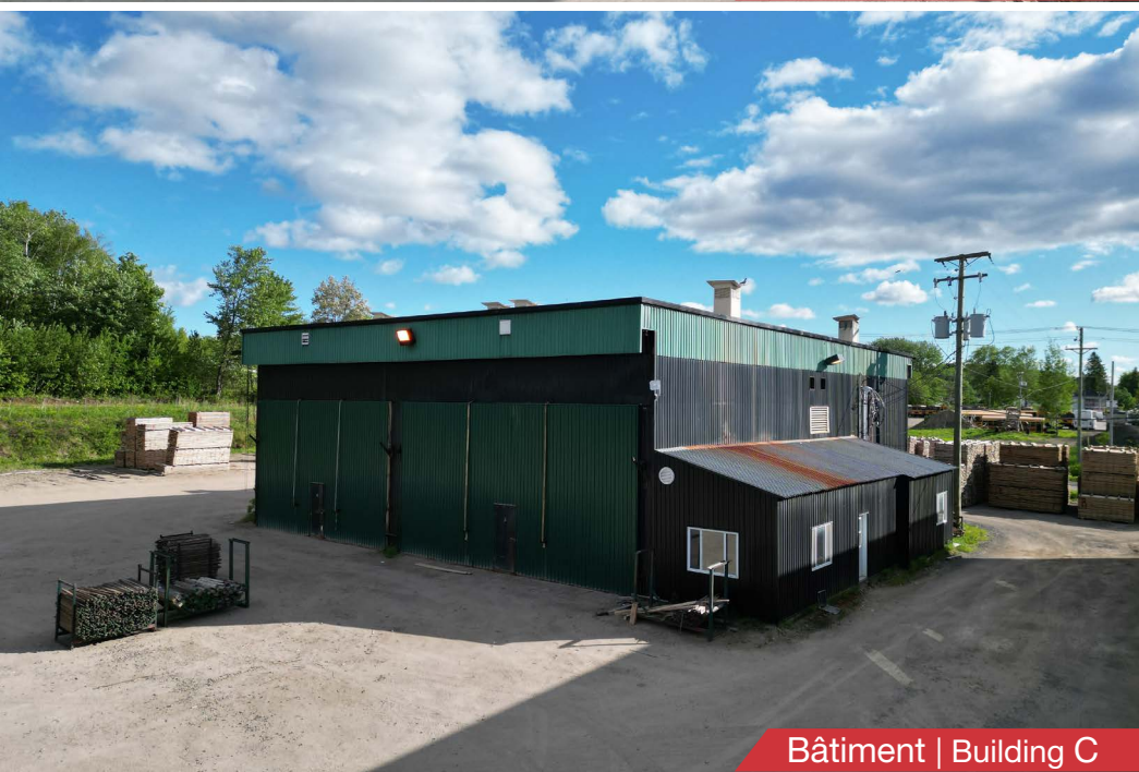
Bâtiment | Building C