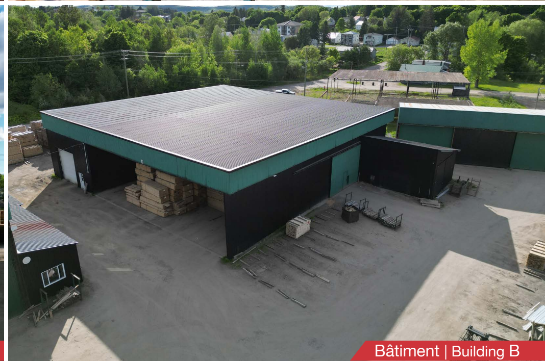
Bâtiment | Building B