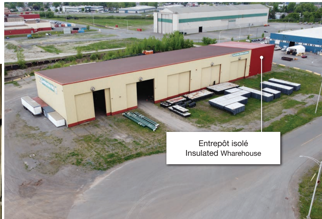
Entrepôt isolé Insulated Warehouse