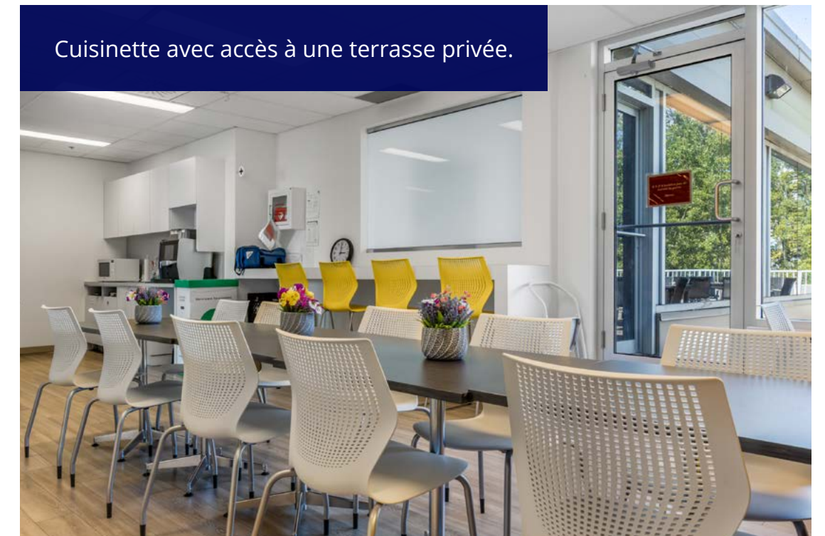
Cuisinette avec accès à une terrasse privée.