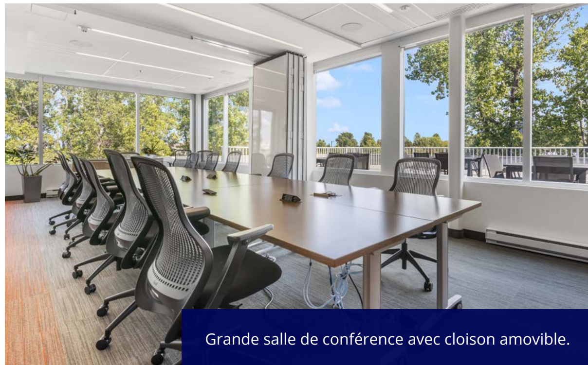
Grande salle de conférence avec cloison amovible.