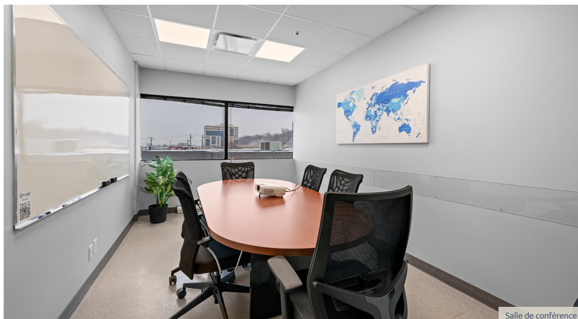
Salle de conférence