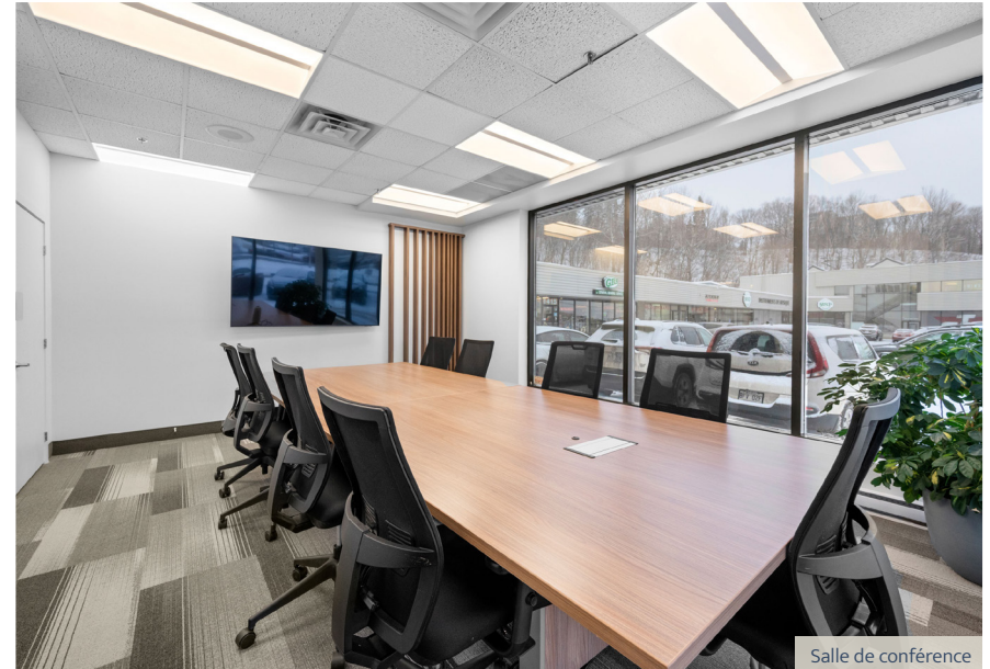
Salle de conférence

Les taux sont exprimés par pied carré par année