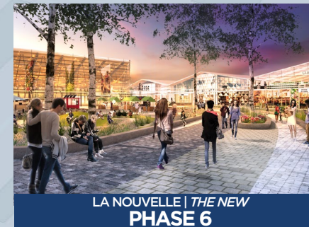
LA NOUVELLE | THE NEW PHASE 6