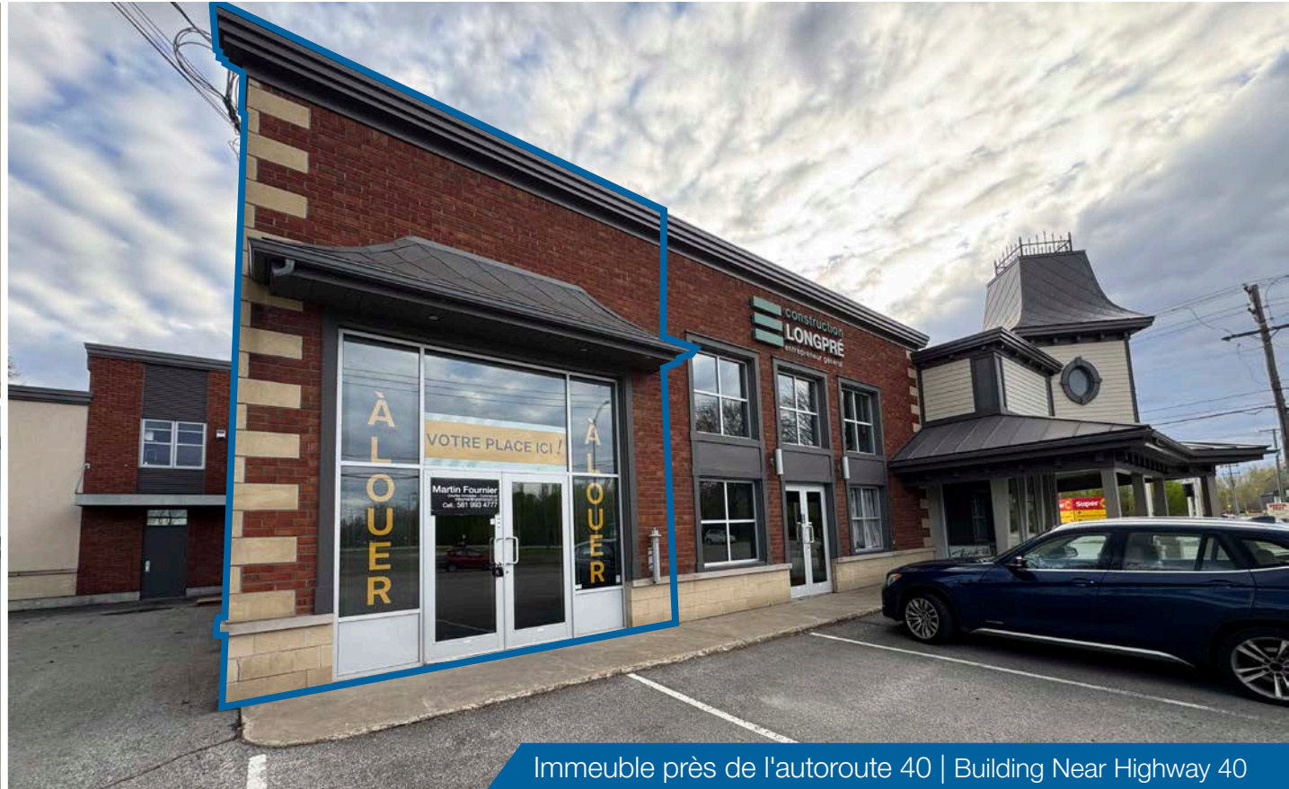
Immeuble près de l'autoroute 40 | Building Near Highway 40