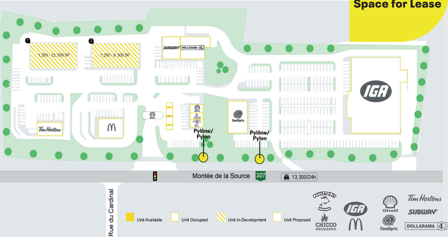
Plan de site - Site Plan