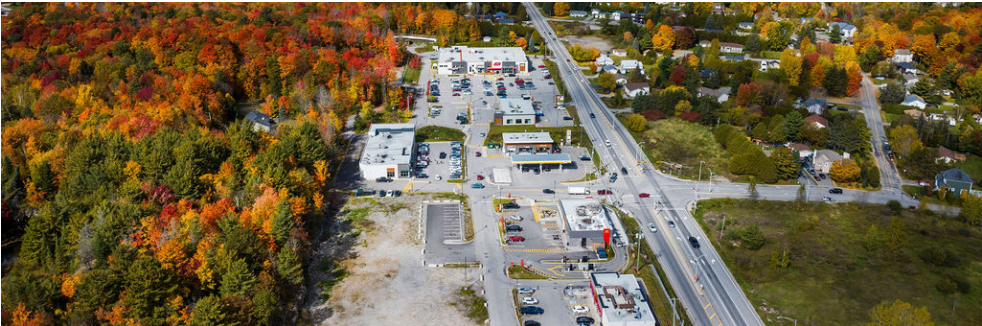
Vue aérienne du Marché Cantley - Marché Cantley aerial view