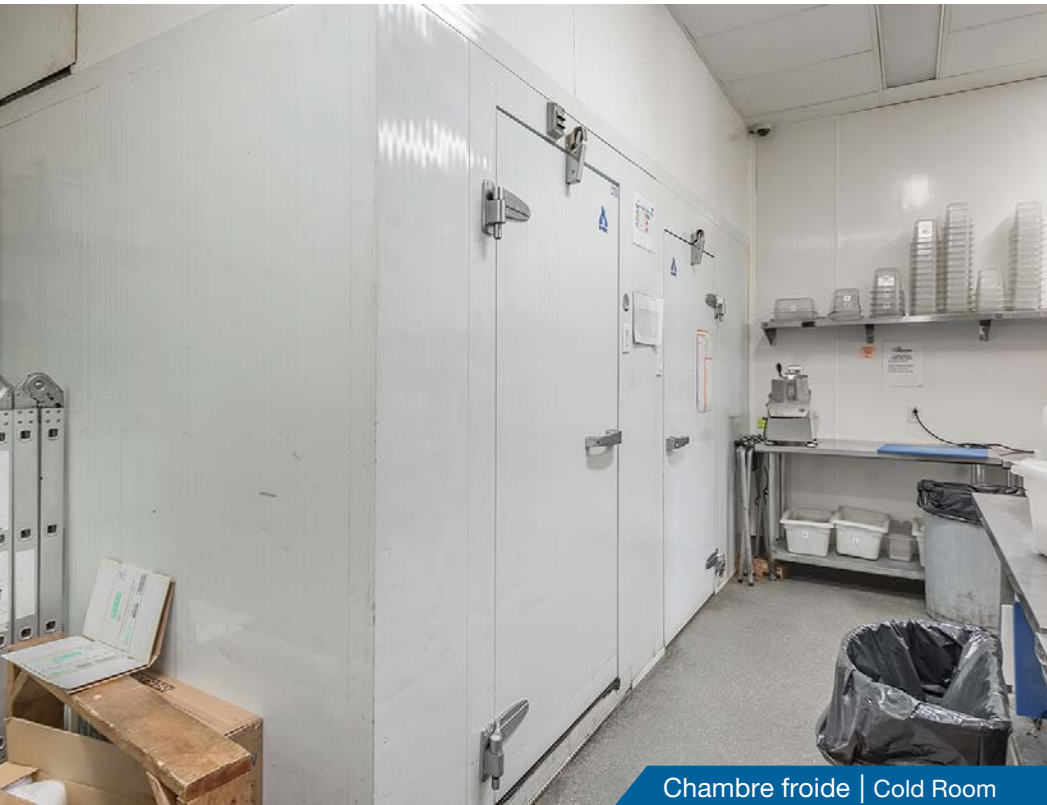
Chambre froide | Cold Room