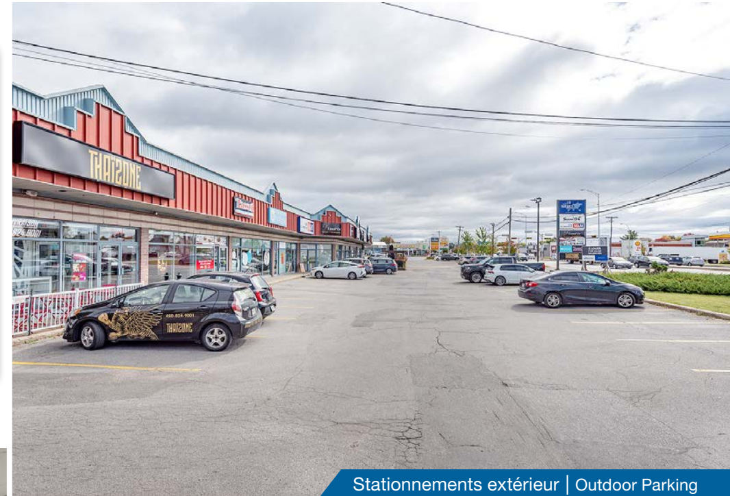
Stationnements extérieur | Outdoor Parking