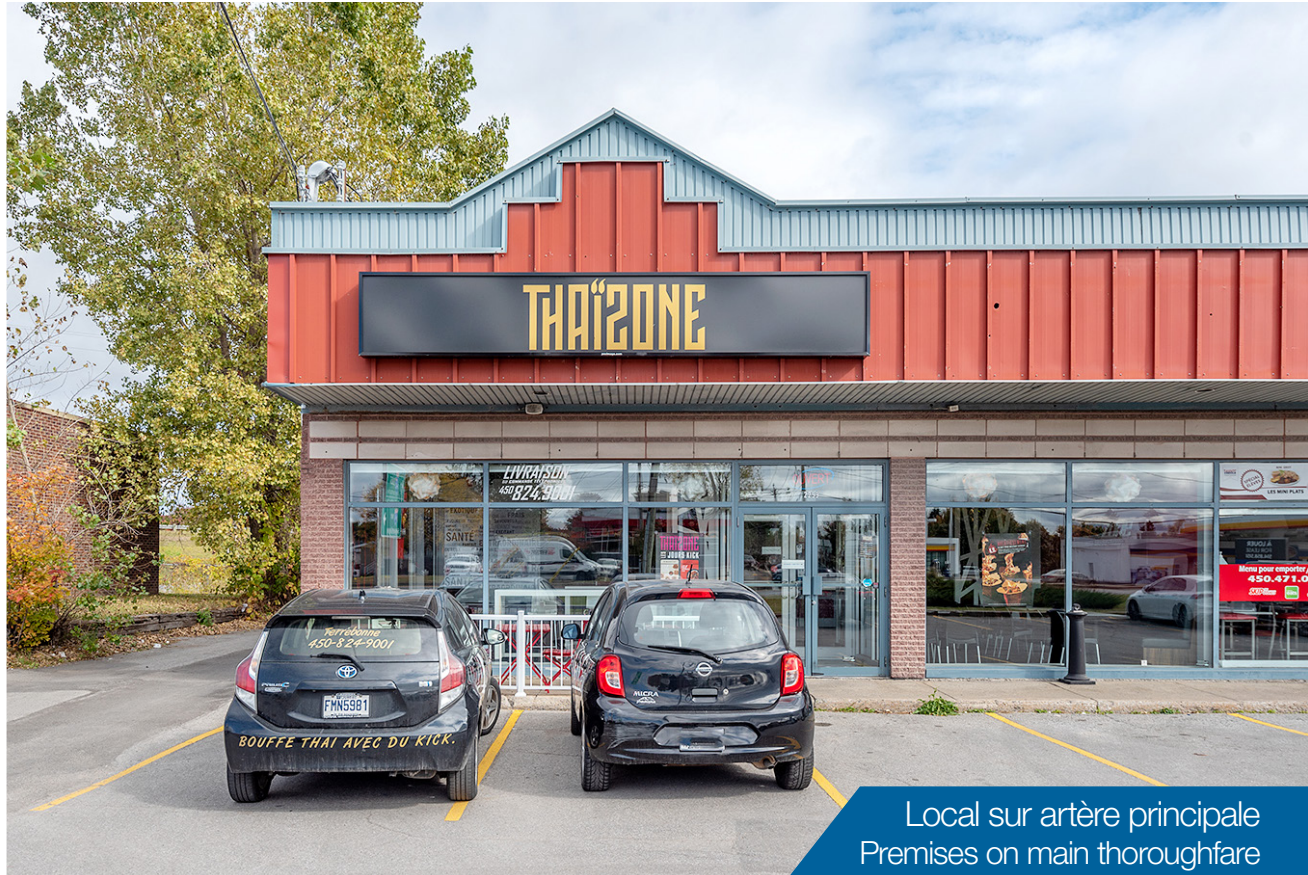
Local sur artère principale Premises on main thoroughfare