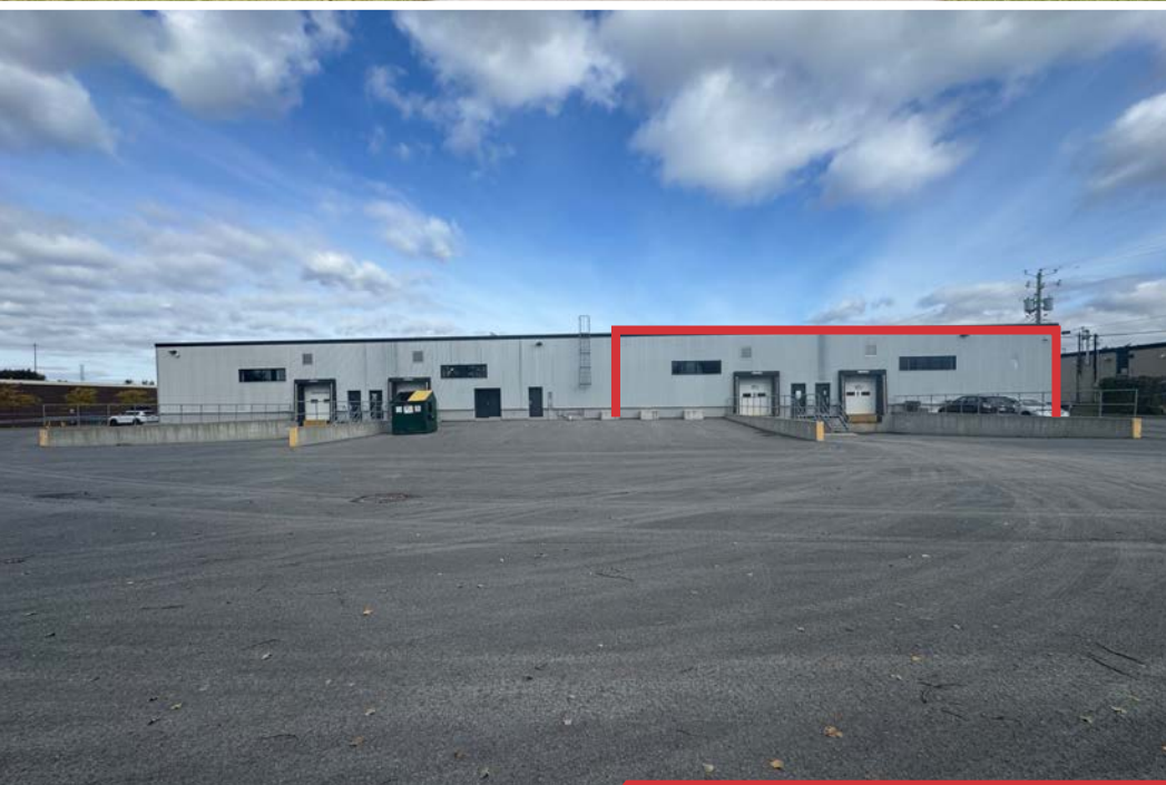
Cour extérieure | Exterior courtyard