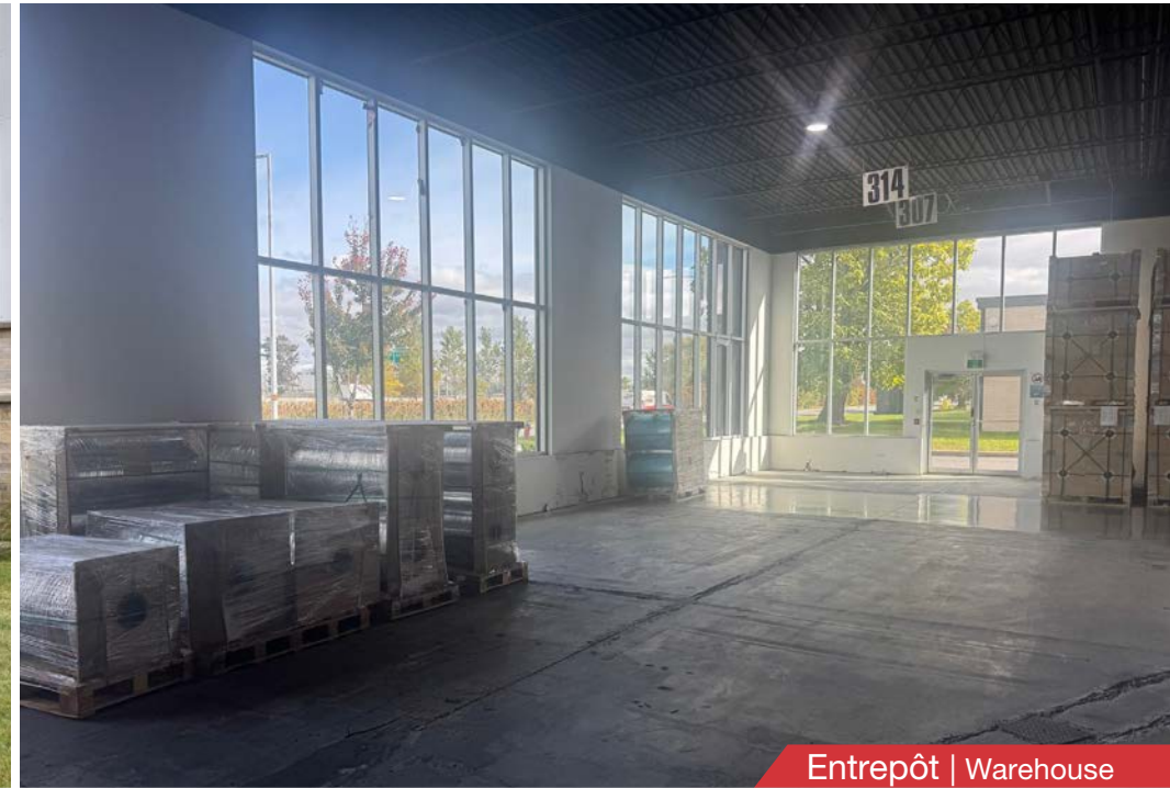
Entrepôt | Warehouse