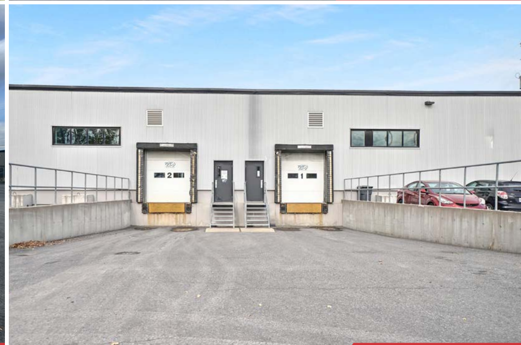
Expédition | Shipping