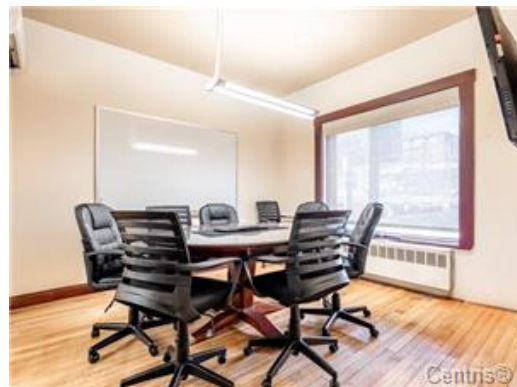
Salle de conférence