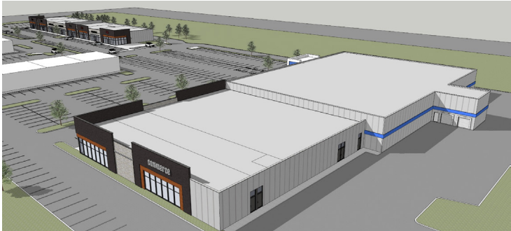
Rendu - Rendering