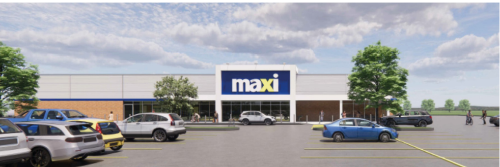
Rendu Maxi - Maxi's rendering