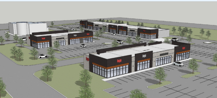
Rendu - Rendering