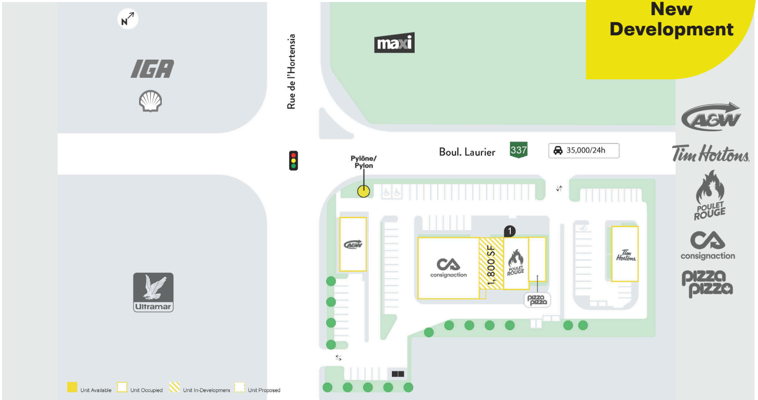
Plan de site - Site Plan