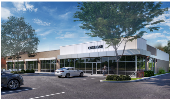
Rendu du nouveau développement - Rendering of new development