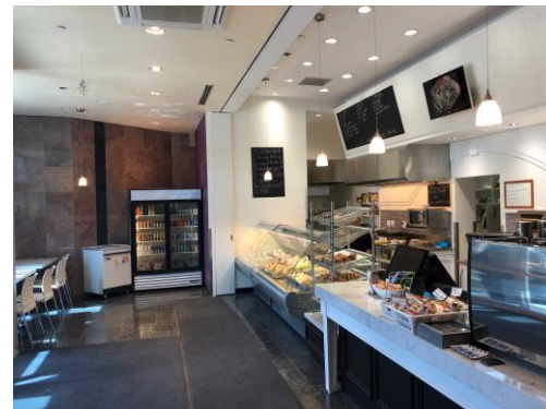
Petit restaurant au RDC / Small Restaurant ground floor