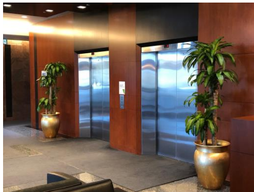
Ascenseurs / Elevators