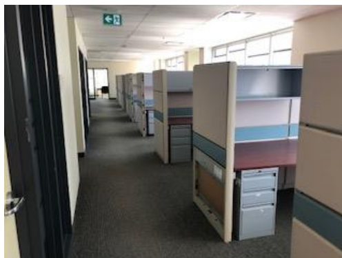
Bureau typique / Typical office area