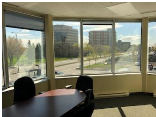
Vue extérieure d'un bureau / Exterior view from office