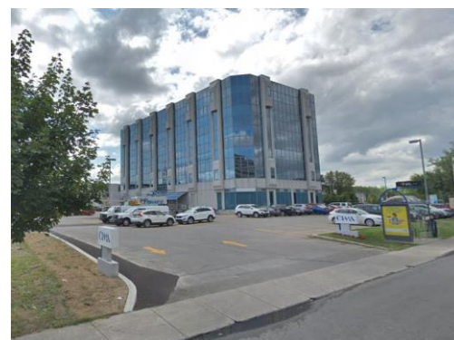
Vue du boul. Chomedey / View from Chomedey blvd