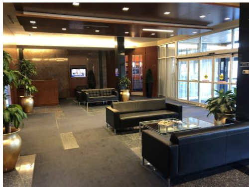
Entrée principale / Building entrance