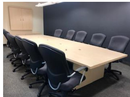
Salle de conférence / Conference room