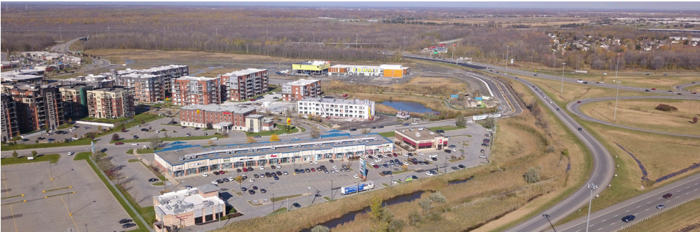
Vue aérienne du Marché Lachenaie - Aerial view of Marché Lachenaie