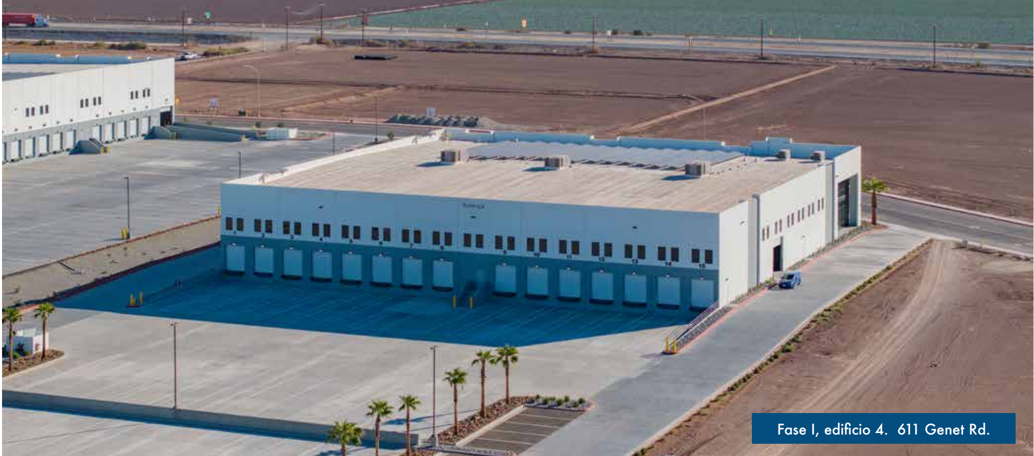
Fase I, edificio 4. 611 Genet Rd.