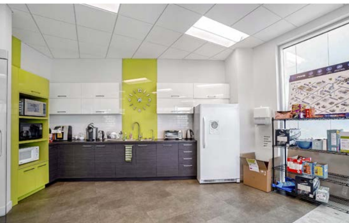
Cuisinette | Kitchenette