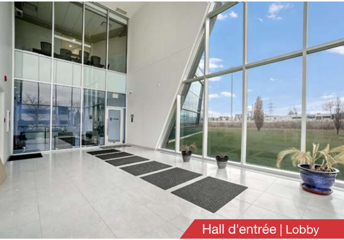
Hall d'entrée | Lobby