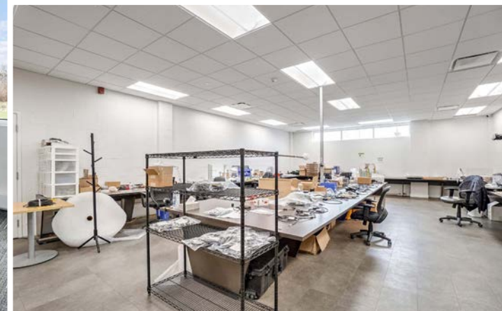
Atelier | Workshop