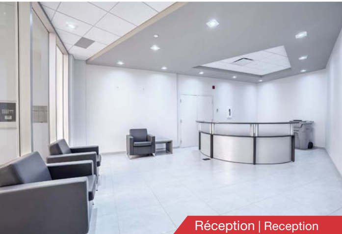
Réception | Reception