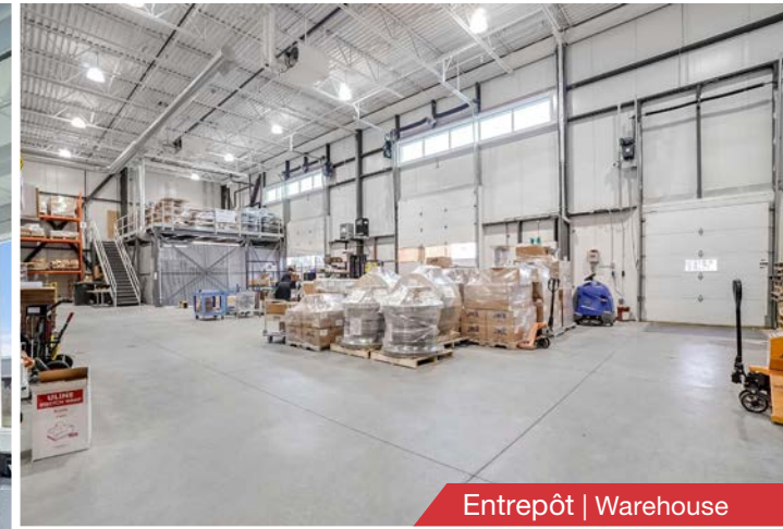
Entrepôt | Warehouse