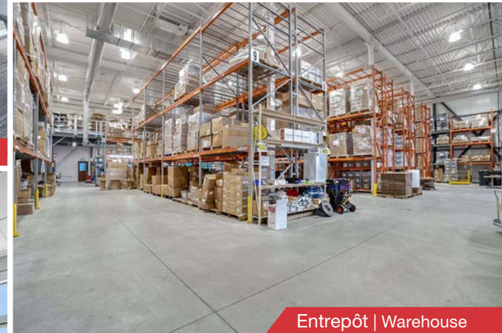
Entrepôt | Warehouse