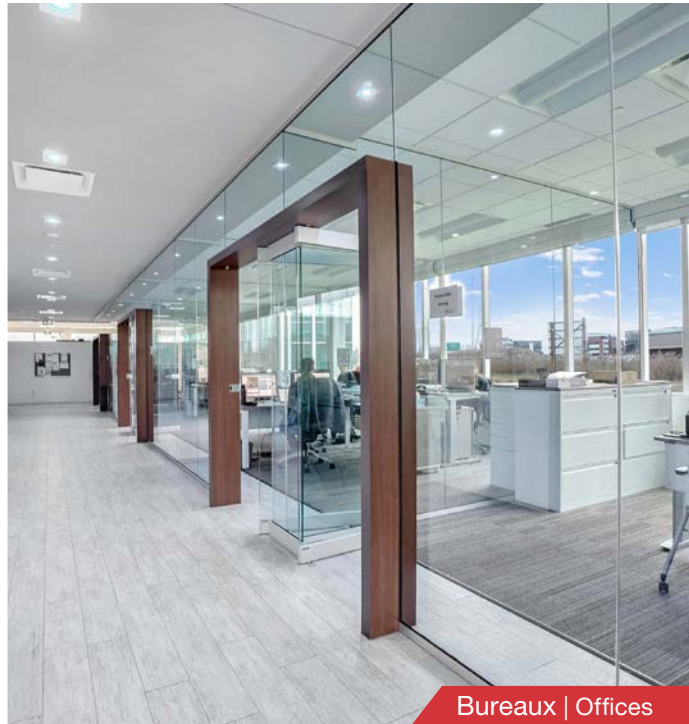
Bureaux | Offices