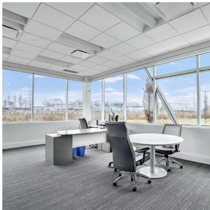
Bureaux | Offices