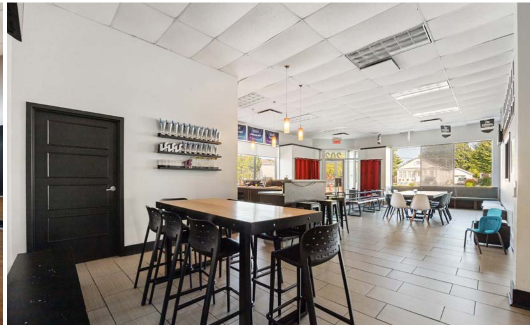
Local | Suite 202 - EDDB inc.

Terme du bail | Lease Term : 30 juin | June, 2027