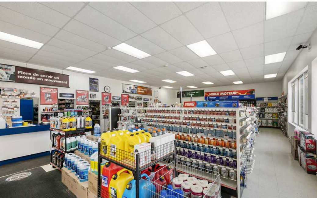
Local | Suite 200 - CarQuest

Terme du bail | Lease Term : 31 jan. 2028