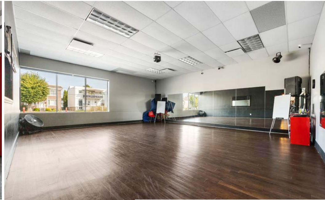
Local | Suite 202 - EDDB inc.

Terme du bail | Lease Term : 30 juin | June, 2027