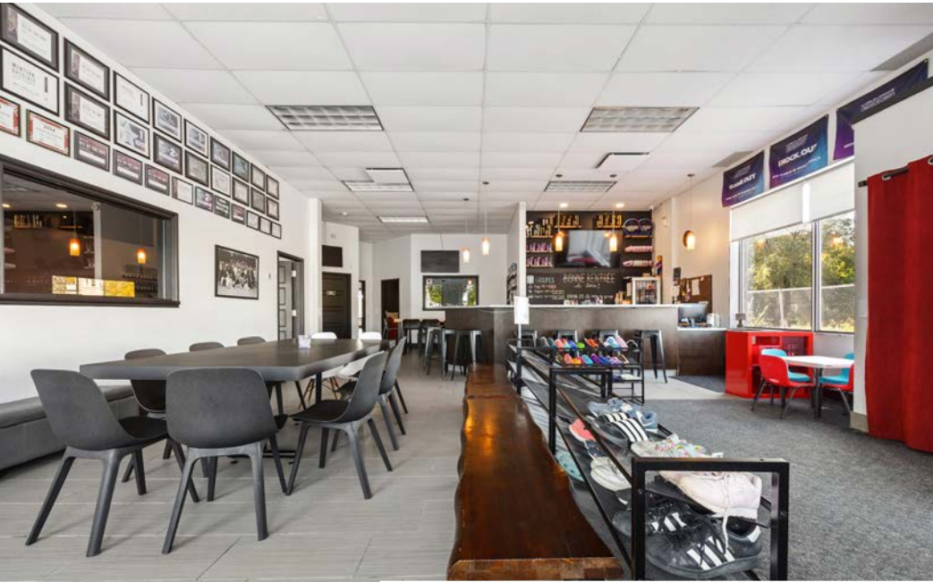
Local | Suite 202 - EDDB inc.

Terme du bail | Lease Term : 30 juin | June, 2027