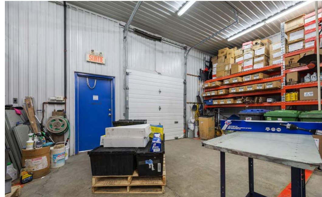
Local | Suite 200 - CarQuest

Terme du bail | Lease Term : 31 jan. 2028