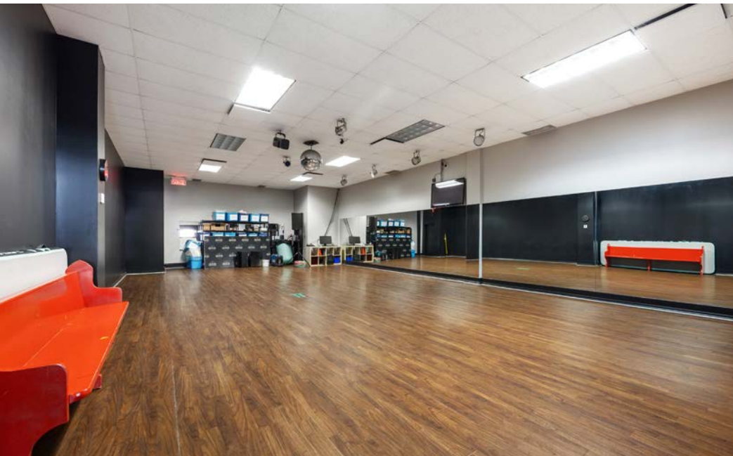
Local | Suite 202 - EDDB inc.

Terme du bail | Lease Term : 30 juin | June, 2027