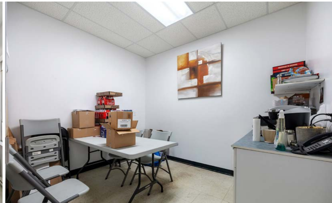
Local | Suite 200 - CarQuest

Terme du bail | Lease Term : 31 jan. 2028