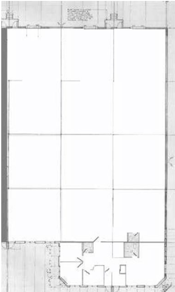
121 Brunswick Blvd